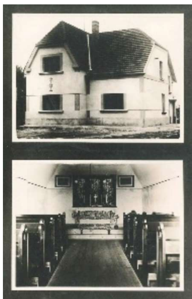
Modlitebna 9. 6. 1930