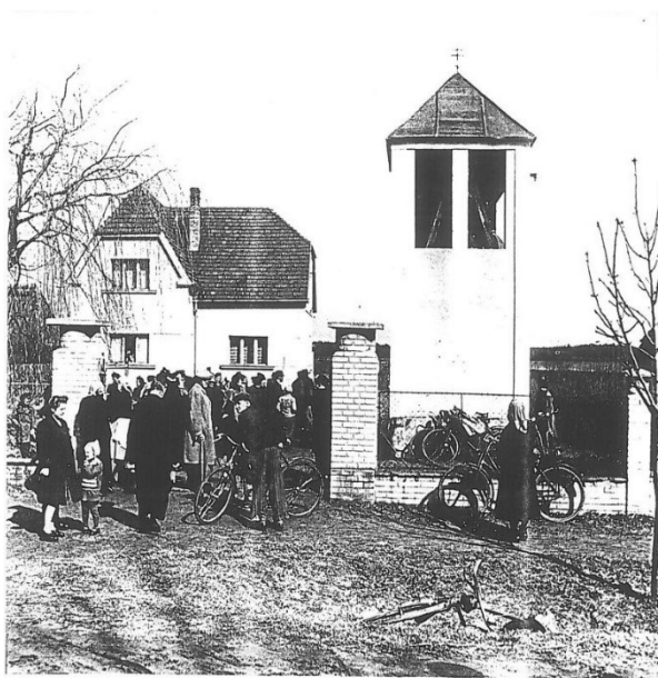
Rok 1942 a sejmuté zvony